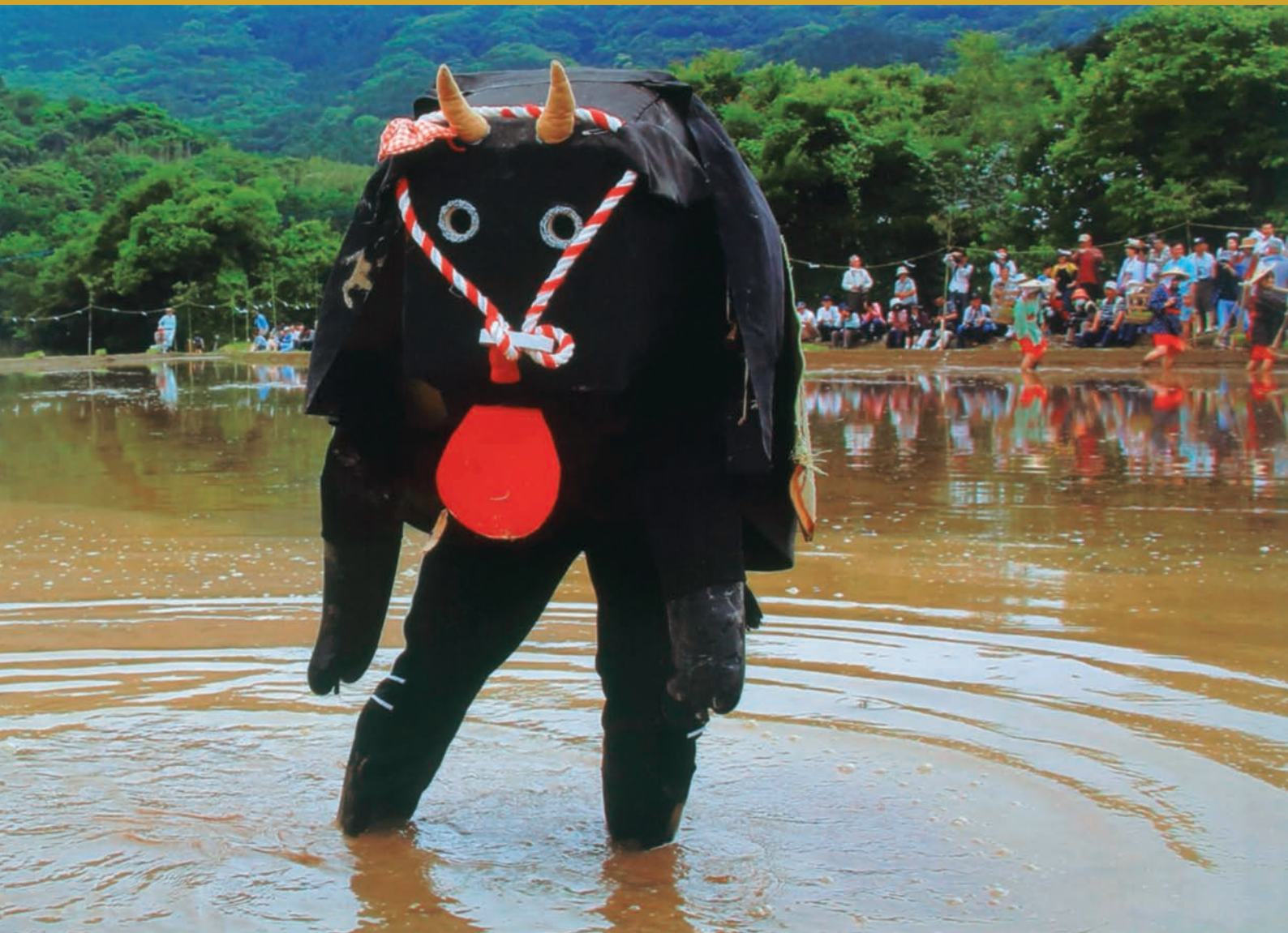
田んぼの働き者（撮影場所：大分県豊後高田市） SCN健康文化センター「写真教室」 岩井 正子

一般財団法人長崎県社会保険協会 長崎県長崎市松山町4番52号 TEL (095) 844-7120 http://www.shaho-nagasaki.or.jp/