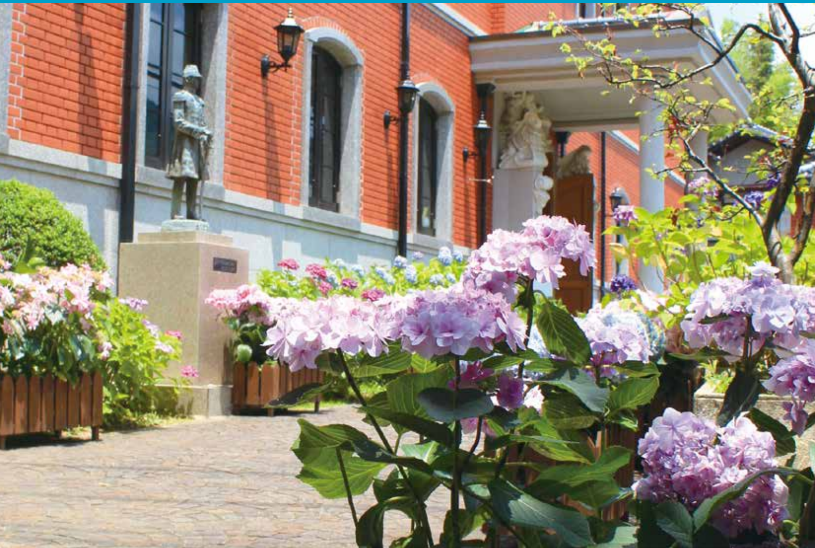
シーボルト記念館

一般財団法人長崎県社会保険協会 長崎県長崎市松山町4番52号 TEL (095) 844-7120 https://www.shaho-nagasaki.or.jp/