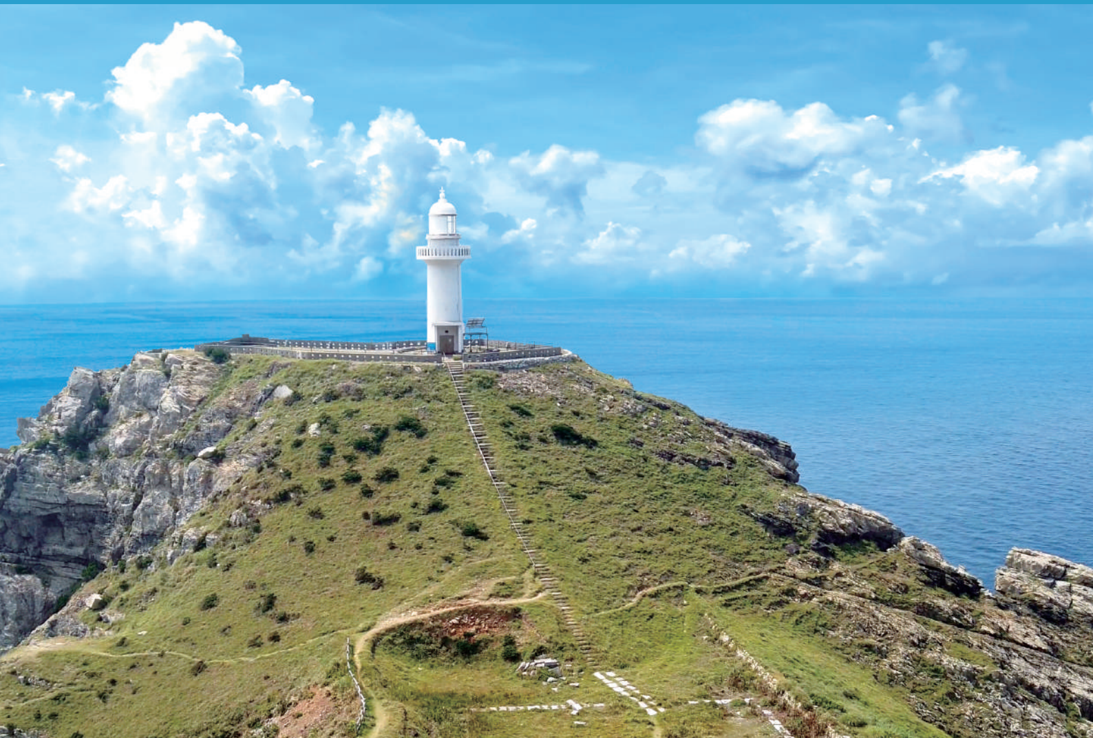
「五島列島 福江島 大瀬崎灯台」

一般財団法人長崎県社会保険協会 長崎県長崎市松山町4番52号 TEL (095) 844-7120 https://shaho-nagasaki.or.jp/