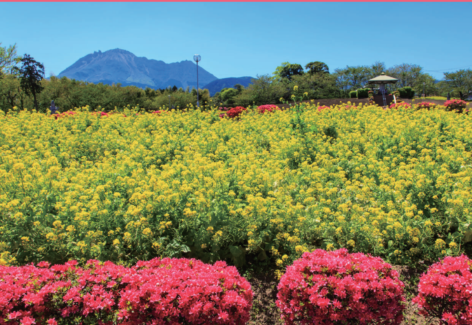
「島原市 有明の森フラワー公園」

一般財団法人長崎県社会保険協会 長崎県長崎市松山町4番52号 TEL (095) 844-7120 https://shaho-nagasaki.or.jp/