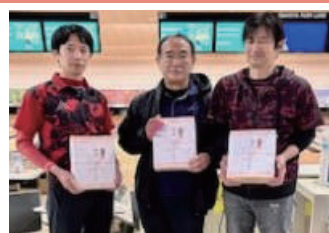
(税)ネクスト・プラス