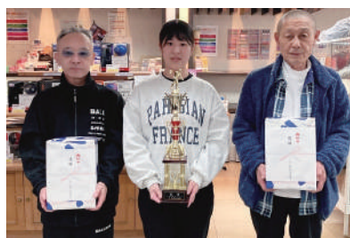
【長崎県大会 優勝チーム】 西肥自動車(株) (佐世保地区) 1,679点