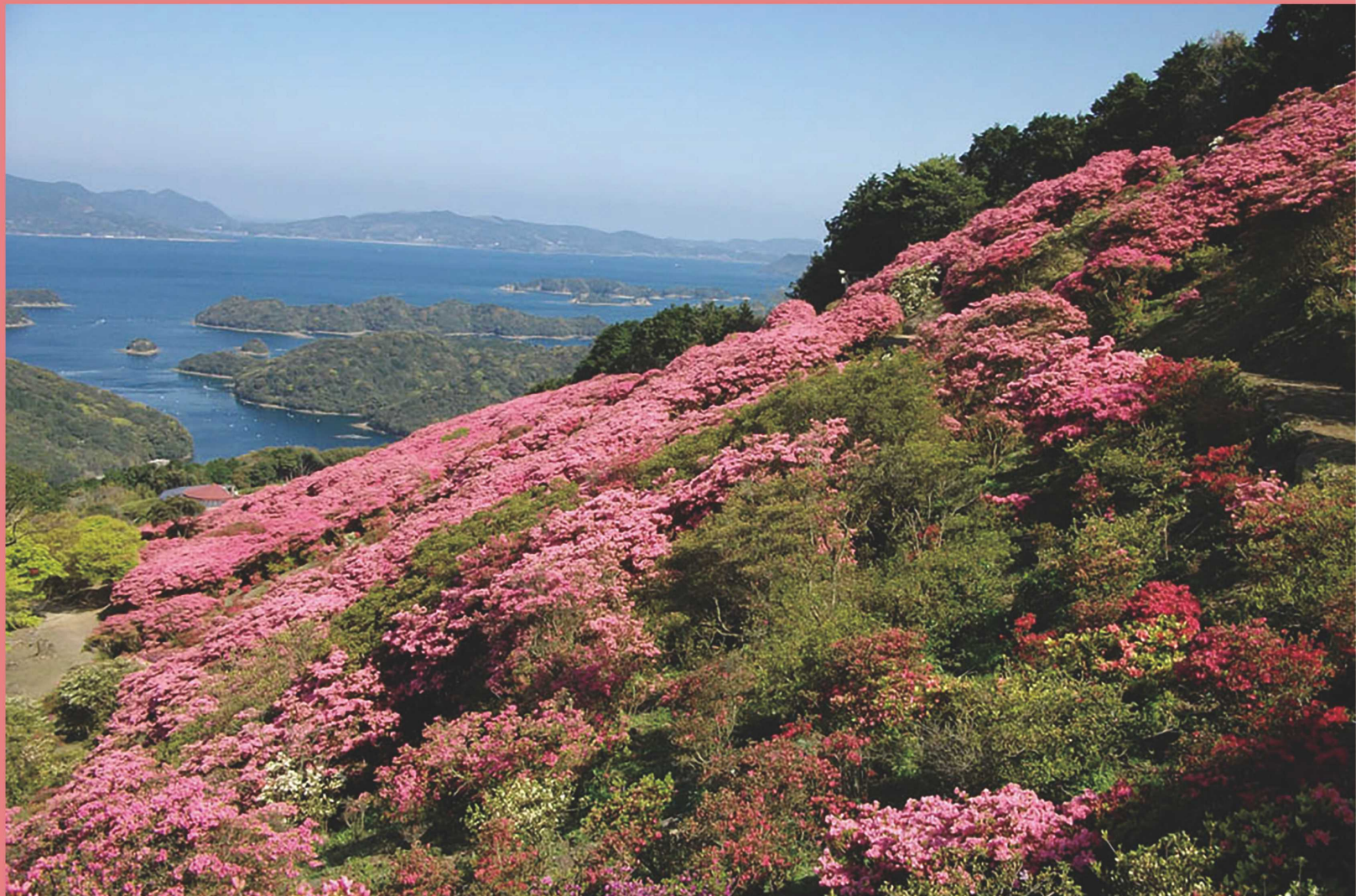
〔佐世保市 長串山公園 ツツジ〕

一般財団法人長崎県社会保険協会 長崎県長崎市松山町4番52号 TEL (095) 844-7120 https://shaho-nagasaki.or.jp/